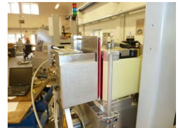
Fig.2 : Vericoder intégré