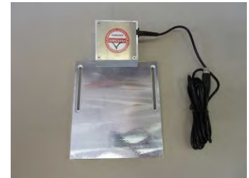
Fig.1: Lecteur de Vericoder

Vericoder est un dispositif de qualité industrielle utilisant la technologie de vérification certifiée par les experts d'Axicon.